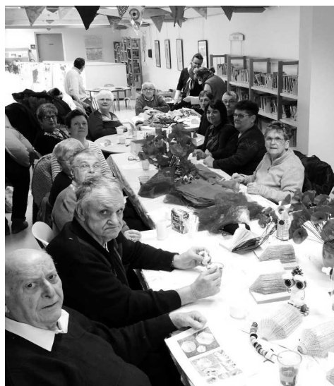
Les participants aux ateliers : bonne humeur et entrain...

Les petites mains poursuivent les préparatifs pour l'organisation du « Défilé des folles coutures ». Écoliers, collégiens, résidents de la maison de retraite et du foyer de vie d'Ancenis, couturières chevronnées et bricoleuses du dimanche tout le monde met la main