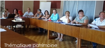
Réunion de travail à Saint-Sulpice-des-Landes

Concrétiser efficacement et durablement un projet de commune nouvelle, tel est l'objectif commun des élus du territoire. Et c'est ensemble qu'ils travaillent sur l'élaboration et la mise en place effective de Vallons de l'Erdre