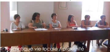
Réunion de travail à Saint-Sulpice-des-Landes

Concrétiser efficacement et durablement un projet de commune nouvelle, tel est l'objectif commun des élus du territoire. Et c'est ensemble qu'ils travaillent sur l'élaboration et la mise en place effective de Vallons de l'Erdre