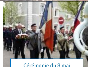
Cérémonie du 8 mai