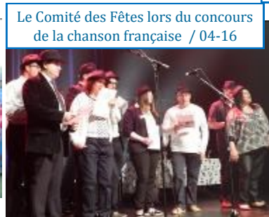
Le Comité des Fêtes lors du concours de la chanson française / 04-16