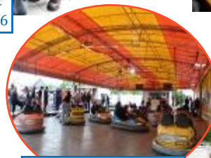
Fête de la Saint-Médard 06-16