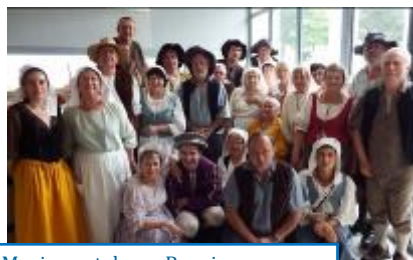
Musique et danse Renaissance avec St Mars Culture et Animation / 05-16