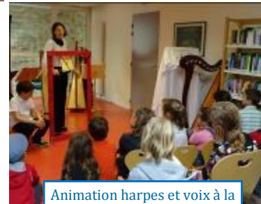
Animation harpes et voix à la bibliothèque / 05-16