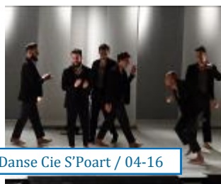
Danse Cie S'Poart / 04-16