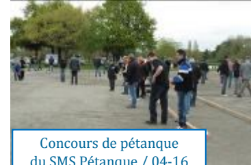
Concours de pétanque du SMS Pétanque / 04-16