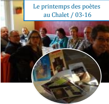
Le printemps des poètes au Chalet / 03-16