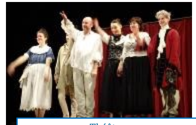
Théâtre « Les murs ont des oreilles »/03-16