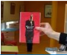
Animation à la bibliothèque « Faites la couv ! » 03-16