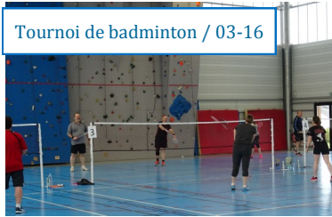
Tournoi de badminton / 03-16