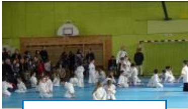
Gala de judo / 03-16