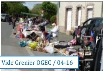
Vide Grenier OGEF / 04-16