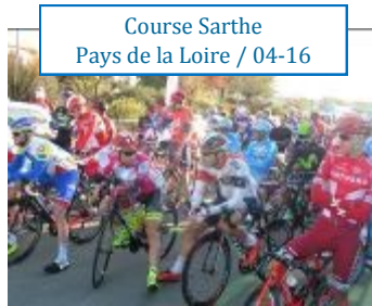
Course Sarthe Pays de la Loire / 04-16