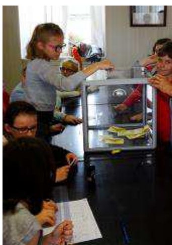
Vendredi 10 juin, les enfants ont élus leurs conseillers municipaux

Les élèves de CE2 et de CM1 des écoles Jules FERRY et Sainte Thérèse - Saint Fernand se sont déplacés à la mairie afin de voter pour le candidat de leur choix.