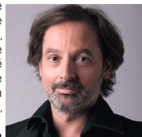
Christophe ALÉVÈQUE sera sur la scène de l'espace culturel en mars 2019 avec son spectacle « Le Tour de la dette en 80 minutes ».

La plaquette de la prochaine saison culturelle sera disponible à compter du mois d'août 2018 dans les accueils des mairies.