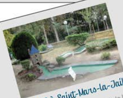
Mini-Golf à Saint-Mars-la-Jaille

📄 cartes à télécharger sur le site de la COMPA