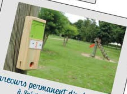
Parcours permanent d'orientation à Saint-Mars-la-Jaille

Des balises sont dissimulées autour du plan d'eau. À vous de les retrouver soit avec le plan, soit avec une boussole !