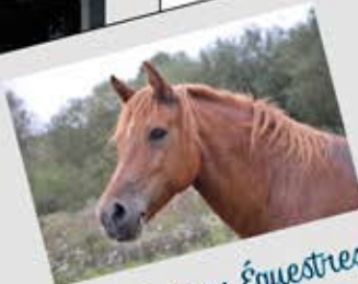
Centres Équestres: Bonnoeuve et Freigné

Enfant (- de 2 ans) gratuit / Enfant (de 2 à 16 ans) 2 € / Adultes 4 €