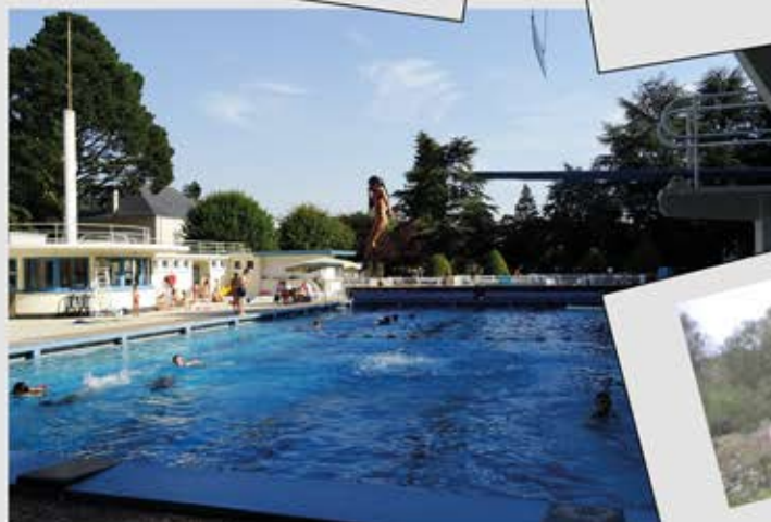
Piscine Alexandre Braud à Saint-Mars-la-Jaille