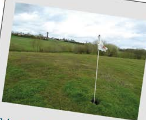
Swim-golf à Saint-Sulpice-des-Landes

Il y a plein de choses à faire à Vallons-de-l'Érdre !