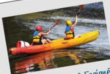
Canoe sur l'Érdre à Freigné

Renseignez-vous à la mairie déléguée de Saint-Sulpice-des-Landes pour récupérer club et balles