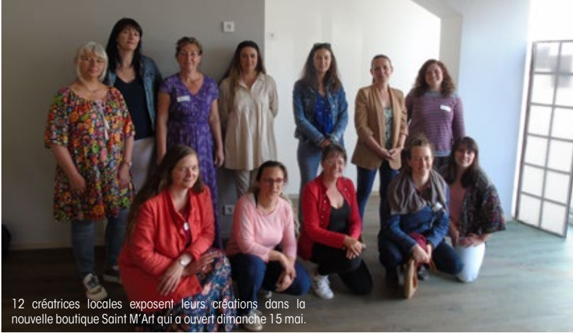
12 créatrices locales exposent leurs créations dans la nouvelle boutique Saint M'Art qui a ouvert dimanche 15 mai.

► Elles seront 12 à exposer leurs créations aux côtés de plusieurs producteurs locaux dans la nouvelle boutique Saint M'Art située au 1, rue de l'Industrie.