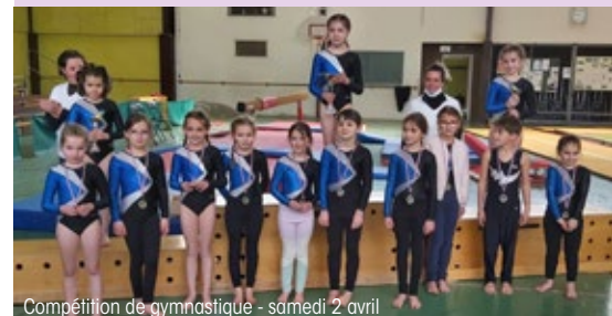
Compétition de gymnastique - samedi 2 avril

Les inscriptions à la gymnastique pour la saison 2022/2023 sont lancées. L'âge minimum est de 6 ans. Pour toute demande d'inscription, veuillez contacter directement l'association.