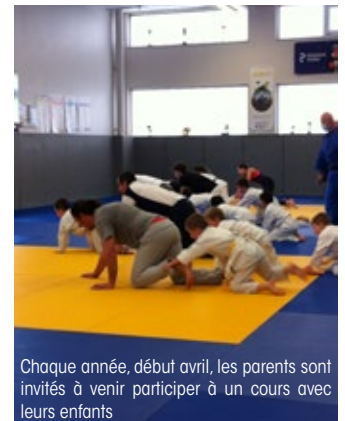
Chaque année, début avril, les parents sont invités à venir participer à un cours avec leurs enfants

Salle de la Charlotte, Saint-Mars-la-Jaille