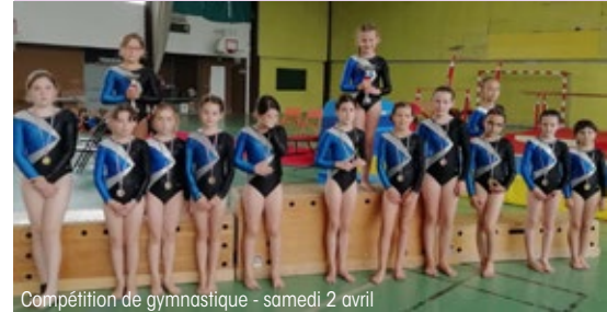
Compétition de gymnastique - samedi 2 avril