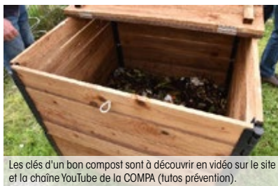
Les clés d'un bon compost sont à découvrir en vidéo sur le site et la chaîne YouTube de la COMPA (tutos prévention).

En compostant, on réduit en moyenne de 30 % le volume de ses ordures ménagères. Au lieu d'alourdir les poubelles et de partir à l'incinération, les déchets biodégradables peuvent devenir un produit naturel fertilisant pour le jardin. Tentés par l'aventure ? La COMPA vous accompagne ! Si vous êtes un groupe volontaire (résidents en collectif, voisins de quartier...), un référent composteur doit être identifié et présenter le projet collectif auprès de la COMPA qui pourra fournir gratuitement un composteur, un brass'compost ainsi que des bio-seaux, et accompagner l'installation.